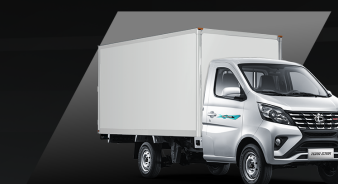
Thùng kín composite