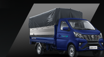
Thùng mui bạt

Đa dạng loại thùng cho nhiều mục đích vận chuyển khác nhau, nổi bật với kích thước thùng hàng siêu dài, giúp chuyên chở khối lượng hàng hóa lớn nhất trong phân khúc tải nhỏ máy xăng, tối ưu hiệu quả kinh doanh.