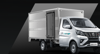
Thùng kín inox