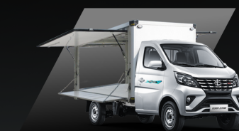
Thùng cánh chim